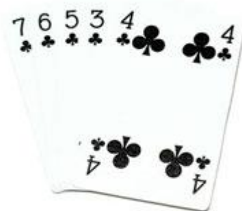
La Quinte flush